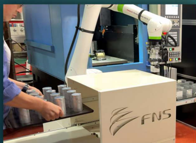
反対側より段替え可能