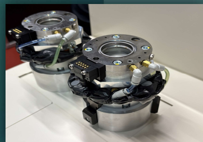
オートハンドチェンジャー搭載